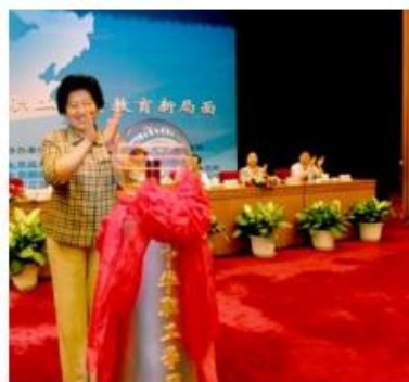
与会首长点击开通中华职工学习网