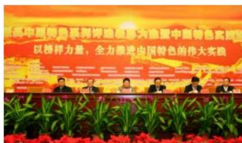
中华职工学习网发起的中国特色实践论坛