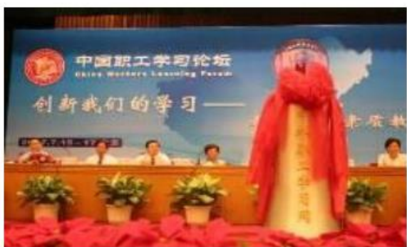
国家十部委主要领导在主席台上就座

中华职工学习网 以打造“百万学习型组织”和“亿万知识型职工”知识管理系统为重点， 致力 为每一个基层工会组织 提供电子学院与电子教室 ，为职工及其家属提供 电子书包 ，把手机变为 移动课本 ，从而 办成一所新型的、信息化的，与时俱进的、覆盖3亿多工会会员和7亿多职工以及家属的没有围墙的24小时开放的现代新型工会大学校。